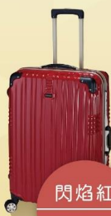
閃焰紅 Flame Red