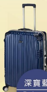
深寶藍 Dark royal blue