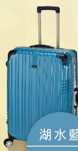
湖水藍 Lake blue