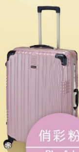
俏彩粉 Playful pink