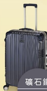
礦石鐵 Ore iron gray