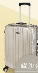
耀沙金 Dazzling alluvial gold